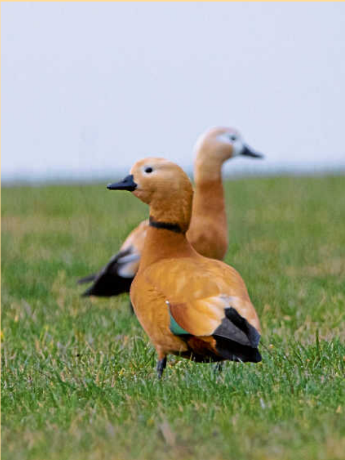
„...Rostgänse in Deckenpfronn“

Schon heute bedanken wir uns für jede tatkräftige Unterstützung und hoffen auf eine zukünftig „saubere Landschaft“!