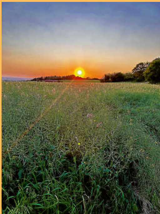
... Sonnenuntergang über Deckenfronn!

Wir veröffentlichen unter dieser Rubrik Fotos zum „Teilen“.