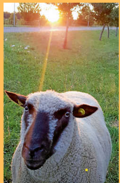
„...Schafbock Pepe im Sonnenaufgang!“