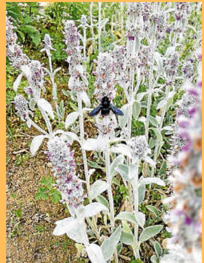
„...eine Holzbiene an einer byzantinischen Woll-Ziestblüte!“