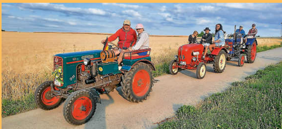
„...Neubulacher Bulldogfreunde bei der Abendausfahrt durch Deckenpfronner Getreidefelder!“