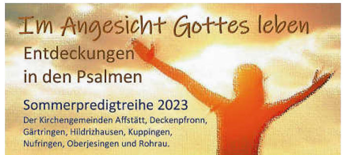
Plakat: Pfr. Flaig

In den Sommerferien findet wieder in bewährter Weise die Sommerpredigtreihe statt, dieses Jahr unter dem Motto: „ Im Angesicht Gottes leben – Entdeckungen in den Psalmen “. Die Gottesdienste finden in dieser Zeit im Wechsel jeweils in Deckenpfronn bzw. in Oberjesingen statt, bitte beachten Sie die entsprechenden Hinweise.