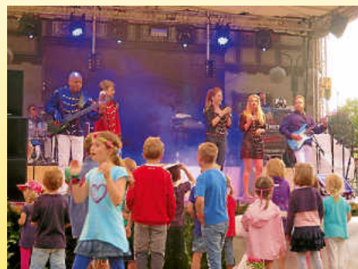
Auftritt des Hofbräuregiments 2016