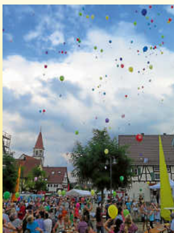
Luftballonstart beim Marktplatzfest 2016