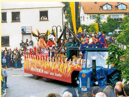
Feuerwehr beim Festumzug 2000

Merken Sie sich diesen Termin bereits heute vor und lassen Sie uns miteinander ein großes Fest feiern!