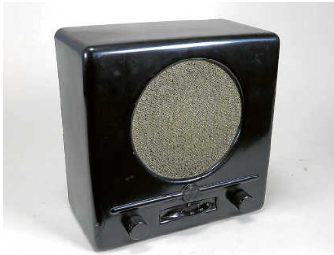
Der Deutsche Kleinempfänger DKE38 war der kleinste und preiswerteste Volksempfänger. Er wurde von 1938 bis 1944 gebaut.

Am übernächsten Sonntag, 29. Januar , ist das Museum in der Zehntscheuer wieder von 14 bis 17 Uhr geöffnet. Um 14 Uhr wird in der Haberkammer die neue Sonderausstellung „100 Jahre Radio in Deutschland“ eröffnet. Es wird ein Geschichtsabriss über die Zeit seit der ersten Rundfunksendung zu Weihnachten 1920 bis zur Gegenwart gezeigt und mehrere alte Radiogeräte ergänzen diesen Rückblick auf die ersten Jahre, auf den 1933 eingeführten Volksempfänger und auf die nach dem Krieg gebauten Modelle wie von Grundig.