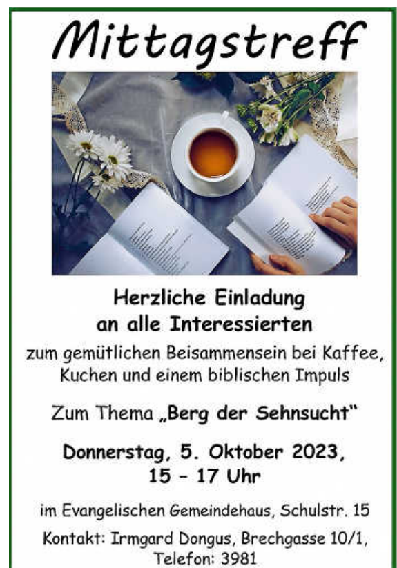
Plakat: Ev. Kirchengemeinde