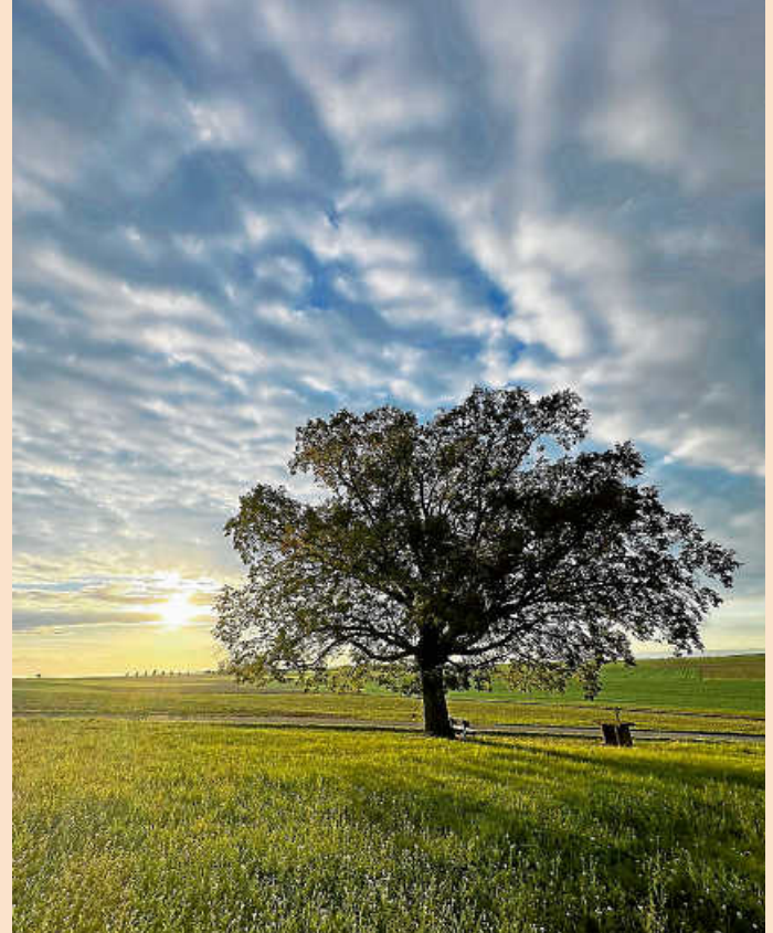
Sonnenaufgang über Deckenpfronn!