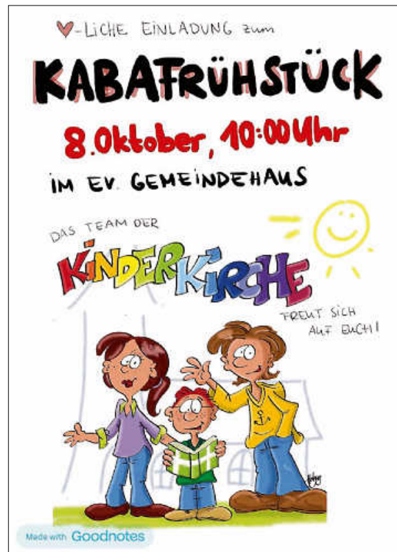
Plakat: Kirchengemeinde Deckenfronn

16:30 Uhr Konfirmandenunterricht im Evang. Gemeindehaus