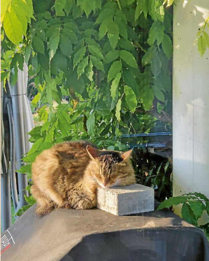
„Unsere Katze hat sich ein besonderes steiniges Kopfkissen ausgesucht. Ob das bequem ist?

Wir veröffentlichen unter dieser Rubrik Fotos zum „Teilen“.