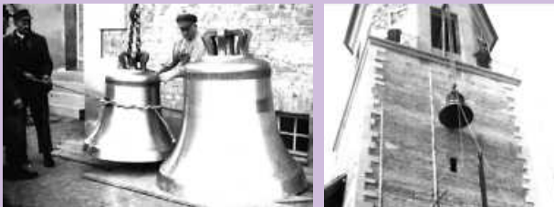
1957: Die Nikolauskirche erhält ein Vierergeläut

Eine Sonderausstellung über Glocken mit der Glockensammlung eines Mitbürgers im Museum Zehntscheuer Deckenpfronn